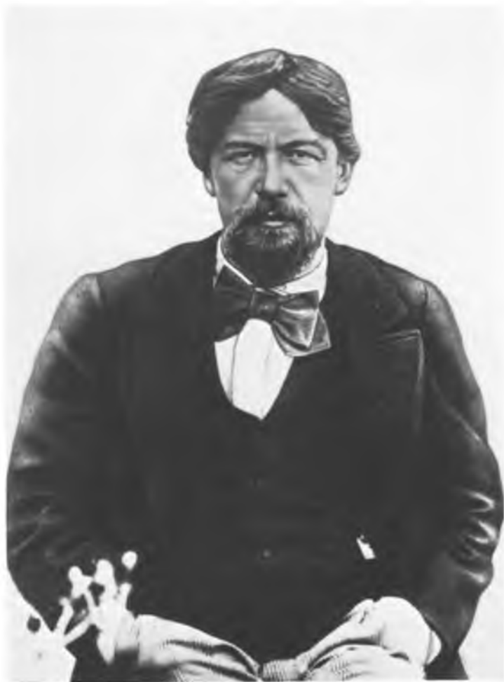
А. П. ЧЕХОВ.